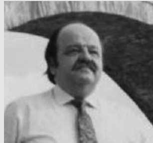
Γράφει ο Γεώργιος Κ. Μάνος

Το μασάζ γινόταν με το λεγόμενο πάτημα. Π.χ. ερχόταν