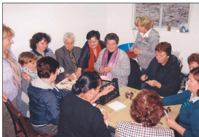
Τα μέλη του Συλλόγου Γυναικών χαρακώνουν τα κάστανα για τη γιορτή που φέτος ήταν 250 κιλά. Προσφορά των καστανοπαραγωγών του χωριού.

Απόλυτα πετυχημένη ήταν και φέτος η γιορτή κάστανου και τσίπουρου που διοργανώθηκε για τρίτη χρονιά με την προσέλευση περισσότερων των 1500 επισκεπτών.