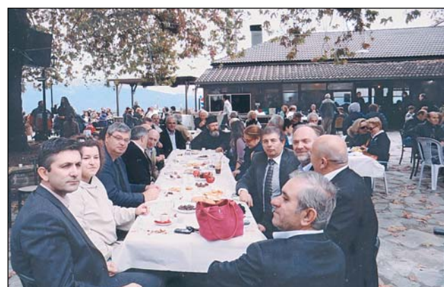
Το τραπέζι των επισήμων στη γιορτή κάστανου και τσίπουρου.