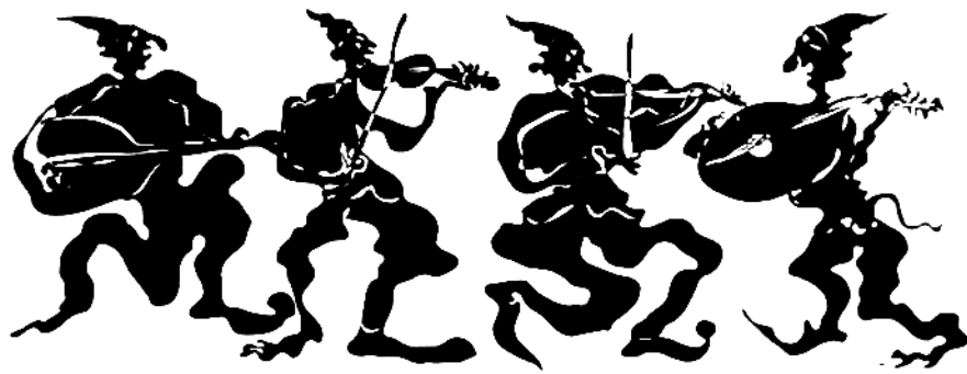
Καλικάντζαροι. (Μουσείο Χαρακτικής Χαμπή)

"...Από τα Γέννα ως τα Φώτα αυτή 'ταν η μυστική λαχτάρα ανάμεσα σε μικρούς και μεγάλους. Θα τα δούνε φέτος τα Παγανά; Κάθε βράδυ γι' αυτά μιλούσαν. Για τα συνήθια και για τα καμώματά τους.